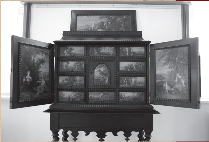
Kabinet Noten, ebben, koper, tin 17 e eeuw, Vlaanderen